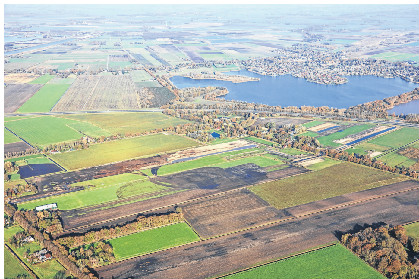
7 november 2020: grondwerk in deelgebied 3 is afgerond, aan deelgebied 2 wordt gewerkt.