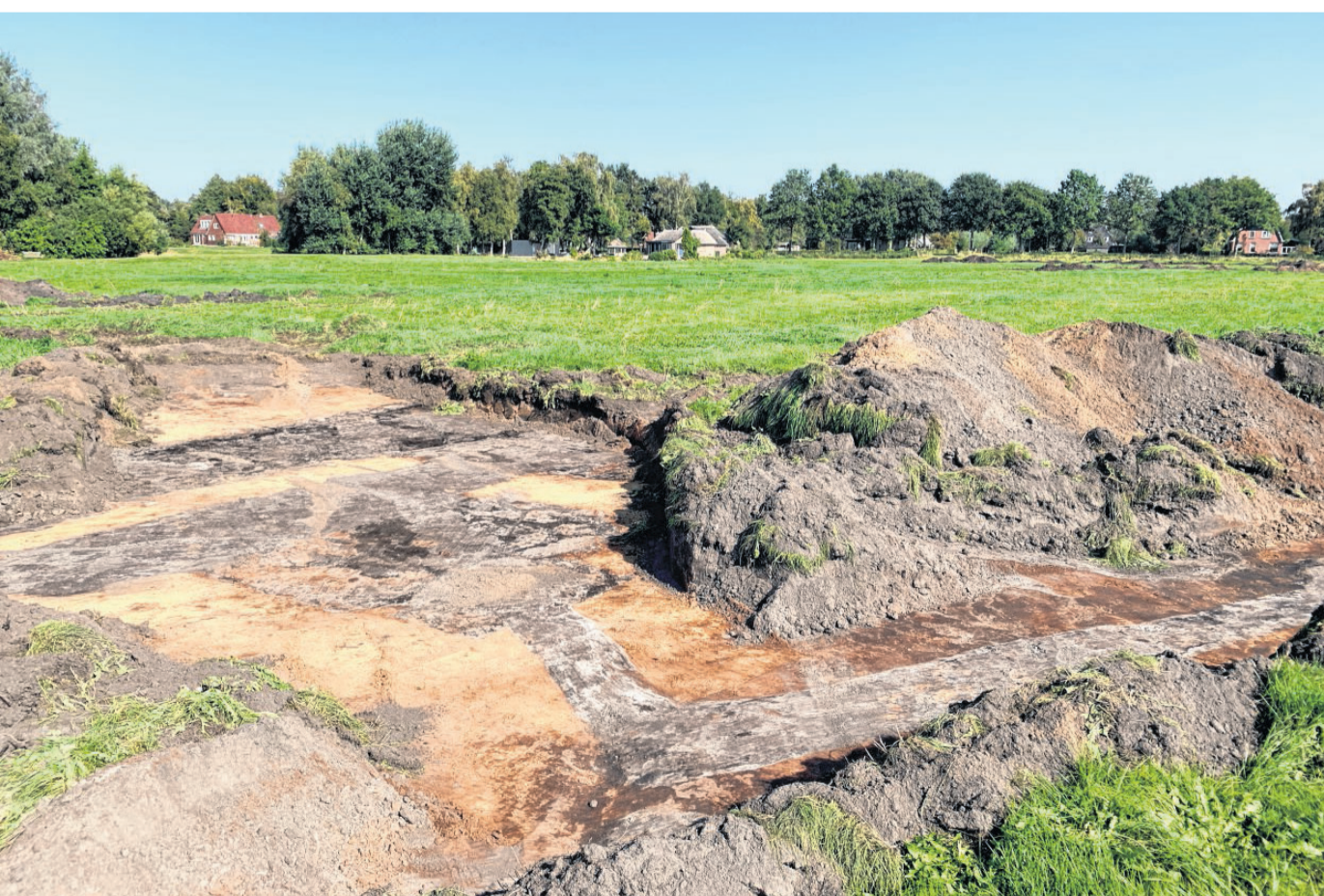
loopgraven